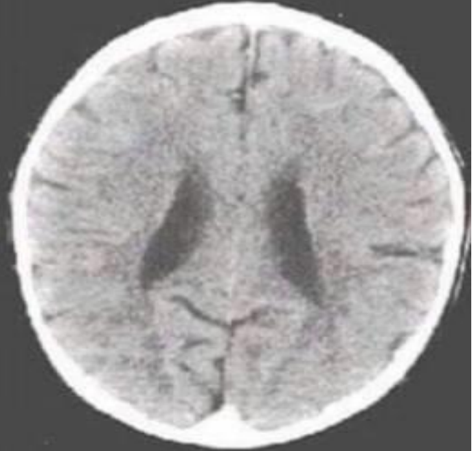
Aşırı İhmal Edilmiş

Bir araştırmada, annesi tarafından ilgi gören ve annesi tarafından ihmal edilmiş ikisi de 3 yaşında olan iki çocuğun beyinleri karşılaştırılmış. İhmal edilen çocuğun beyнинin ilgi görene göre anlamlı derecede küçük olduğu tespit edilmiş. (Araştırmayı okumak için için: Bruce D. Perry, 2001)